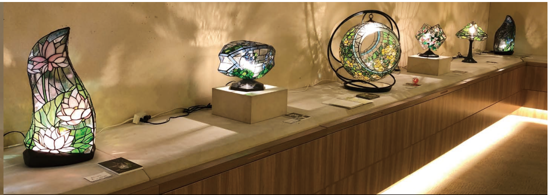
小田急百貨店新宿店 美術画廊